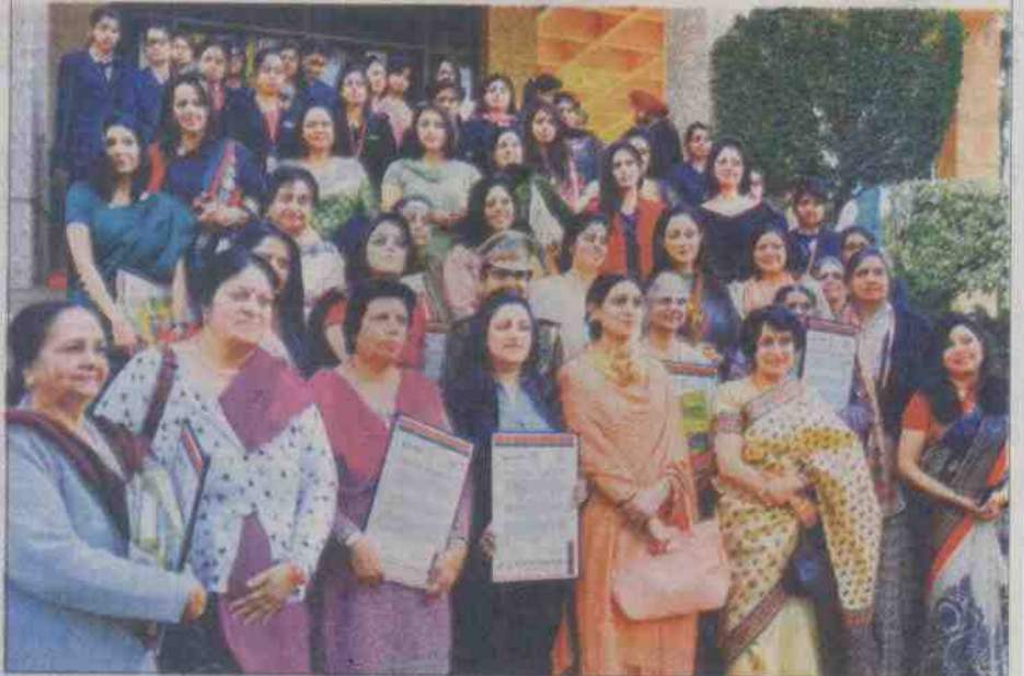
चंडीगढ़ सेक्टर 31 में सोमवार को सीआईआई में गुरुकुल विद्यापीठ द्वारा आयोजित अंतर्राष्ट्रीय महिला दिवस के अवसर पर पुरस्कार वितरण समारोह के बाद प्रसन्न मुद्रा में महिलाएं।